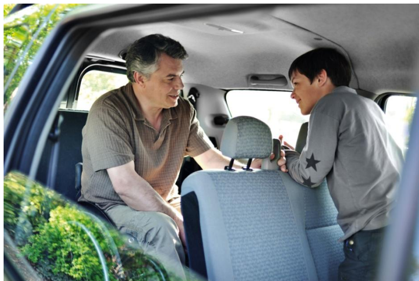
Espaço e convivialidade